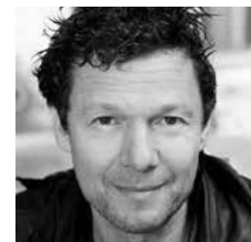
JÉRÔME KIRCHER