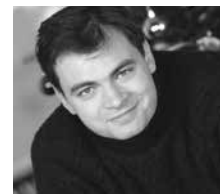
C. CORNILLAC © C. Lartige