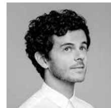
M. GREGORIO