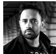
XAVIER GALLAIS

traduction Françoise Brun © Gallimard, 2002